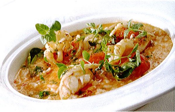
↑ 3コースエグゼクティブ平日セットランチ $25、5コースルーフトップセットディナー $58 とリズナブル

8 Raffles Ave. #01-13 Esplanade Mall 12:00-15:00 18:00-23:00 無休 www.aldente.com.sg