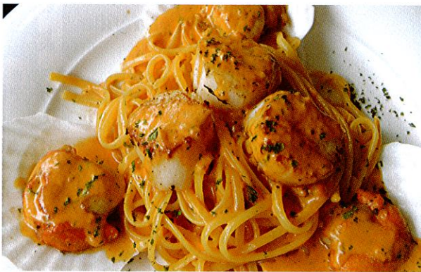
↑ たっぷりホタテ入りのリングイネ Linguine con Capesante $24

110 Upper East Coast Rd. 月～土 12:00-14:30 18:30-22:30 日 11:00-23:00 無休