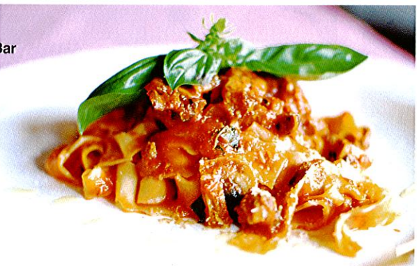
↑ Linguine All'aragosta (ロブスターのリングイネ、$38)はボリュームもたっぷり

15 Merbau Rd. (Robertson Quay Hotel 1F) 18:00-24:00 (L.O.) 無休 www.thesailors.com.sg